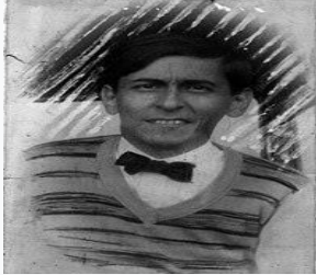
José Carlos Mariátegui. Febrero de 1930.

innumerables contratos y alcabalas y actualmente, al dejar en sus manos las regalías que produce la explotación de recursos naturales por las multinacionales e innumerables contratos para complementarlas. En estas condiciones, cualquier descentralización termina con el resultado esencial de un acrecentamiento del poder del gamonalismo.